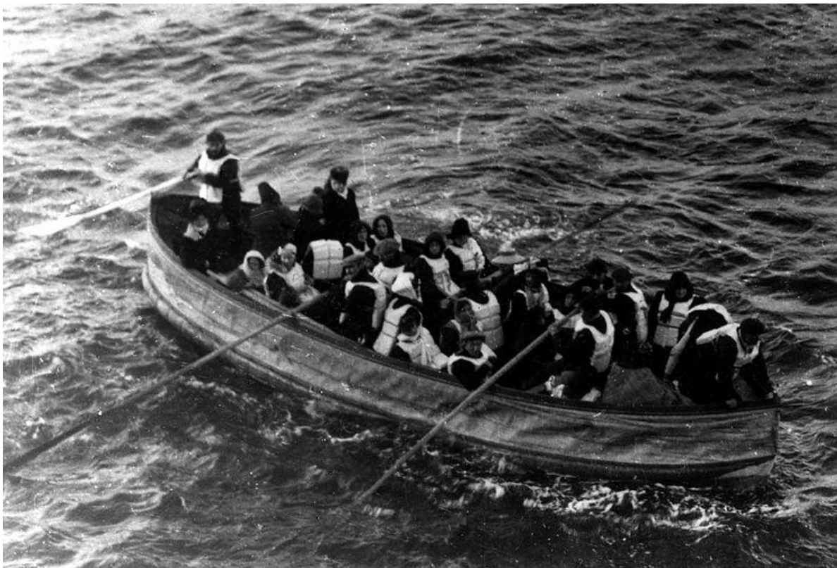
En av livbåtarna med överlevare från Titanic. Fotot taget av en passagerare på fartyget Carpathia.